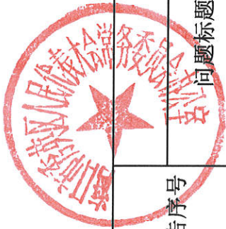
代表工作项目存在问题情况表