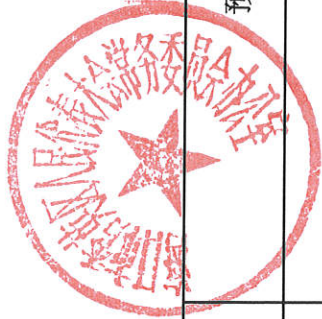
代表工作项目资金情况表